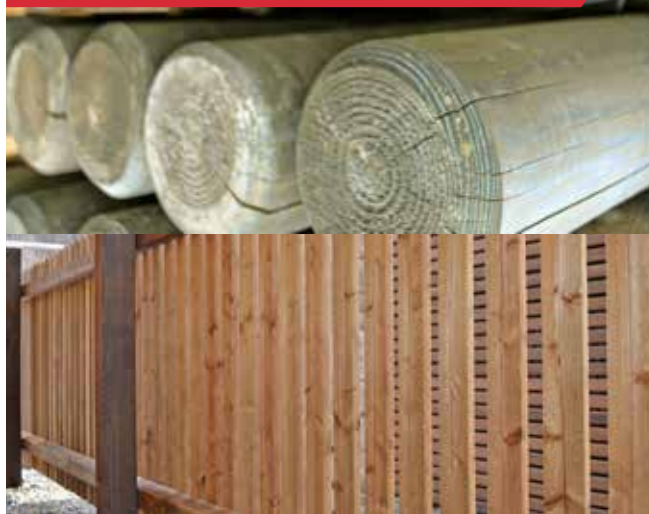
Bois impregné (poteau téléphone, clôtures)