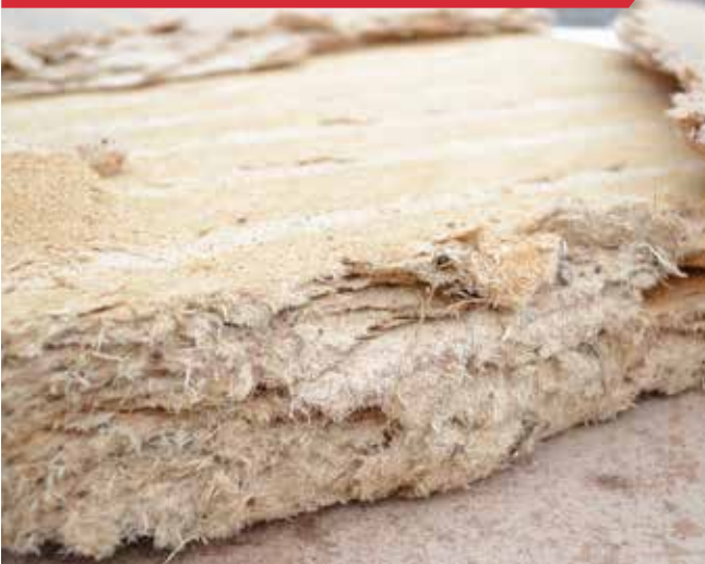
Tous les panneaux de fibres