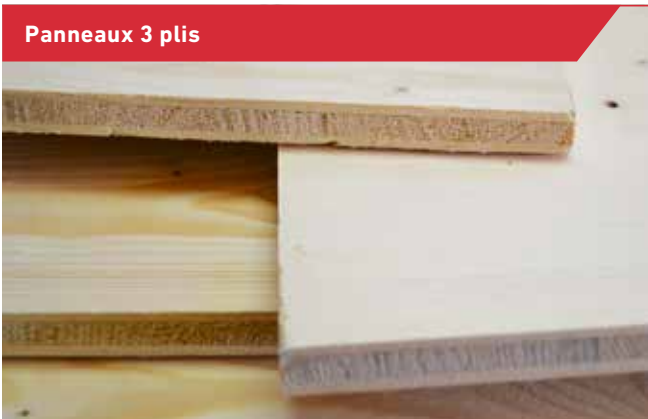
Panneaux 3 plis