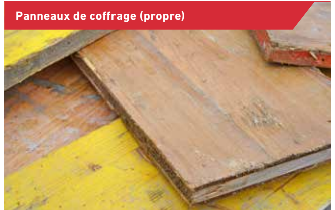
Panneaux de coffrage (propre)