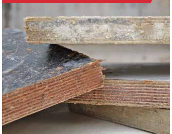
Contreplaqué avec revêtement en résine