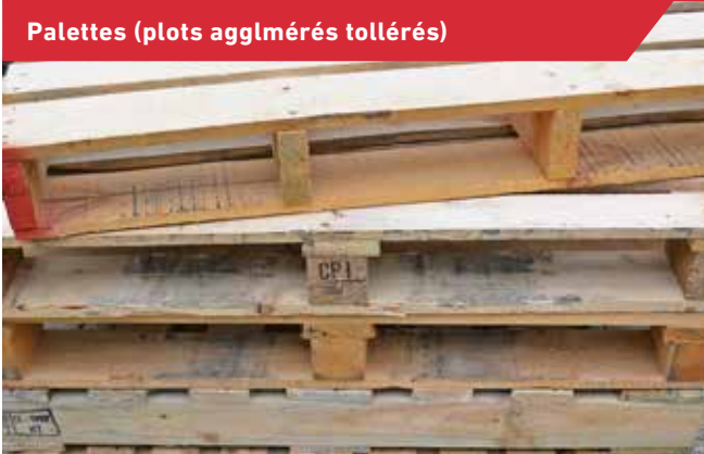
Palettes (plots agglomérés tollérés)