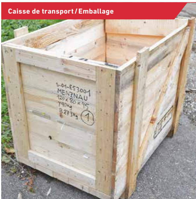
Caisse de transport/Emballage