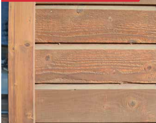
Coffrage de facade impregné